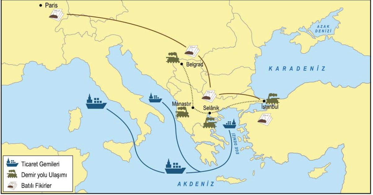
Harita: Selânik'in coğrafi konumu

Sadece verilen görselden yararlanarak Selânik şehri için aşağıdakilerden hangisi söylenemez?