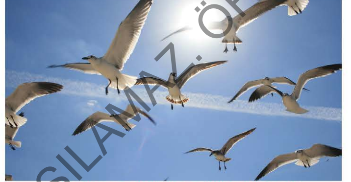
Martılar, güneşin sıcak bakışlarını mutluluk içinde selamladı.

"Kuşlar neşe içinde cıvıldaşıyor; ovadaki bütün çiçekler de el ele tutuşmuş, hep bir ağızdan şarkı söylüyordu." cümlesinde kişileştirme sanatından yararlanılarak aktarma yapılmıştır.