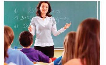
Öğretmenimiz tatlı dilliydi.