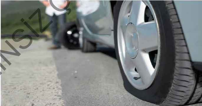
Lastiği patlayan araba yolda kaldı.

"Arıların vızıltısı ta buraya kadar geliyor." cümlesinde "vızıltı" ismi, yansıma olan "vız" sözcüğünden türemiştir.