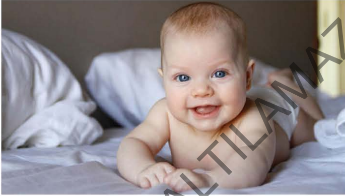
Çocuklar, dünyanın en tatlı varlıklarıdır.

Örneğin, somut anlamıyla “şeker tadında olan” “tatlı” sözcüğü, “Çocuğun tatlı tebessümlerine bayıldım.” cümlesinde “hoşa gidecek biçimde” anlamına gelerek soyut bir anlam kazanmıştır. Böylece sözcük mecaz anlam yüklenmiştir.