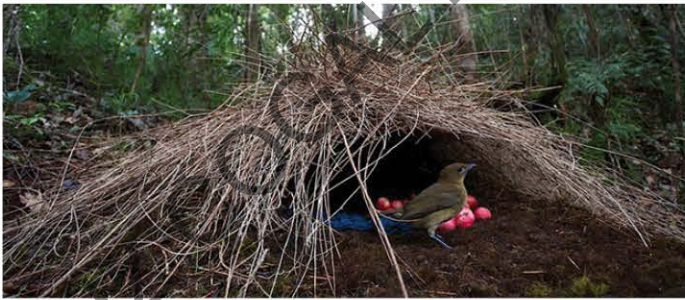
Kuşlar, yumurtalarını yuvalarında muhafaza eder.

Sığınak: Yağmur, güneş veya çeşitli tehlikelerden korunmak için sığınılacak yer, melce.