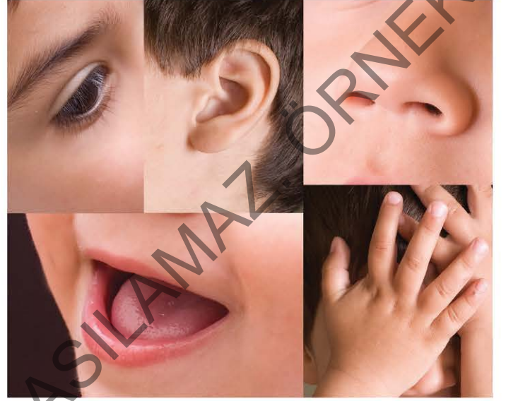
Beş duyu organımızla somut varlıkları kavrarız.

“Hayatım, bir film şeridi gibi gözümün önünden geçti.” cümlesinde soyut bir anlam taşıyan “hayat” kavramı, filme benzetilerek somutlama yapılmıştır.