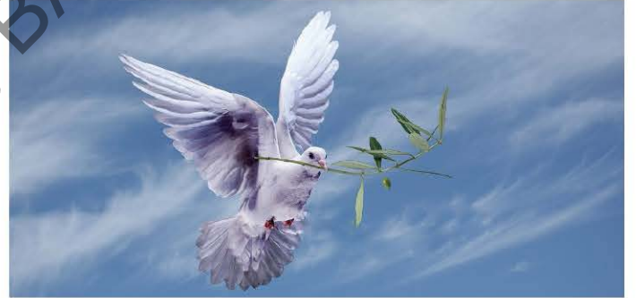
Güvercin ve zeytin dalı "barışın simgesi" dir.

"Güvercin" in barış elçisi simgesi olması veya "zeytin dalı"nın barış sözü ve davranışını karşılaması gibi. Bu iki varlığın yani güvercin ve zeytin dalının "barış" kavramını simgeleştirmesi bu anlamsal süreci açıklamaktadır. Şimdi bir sözcüğün anlam kazanması sürecine bir göz atalım: