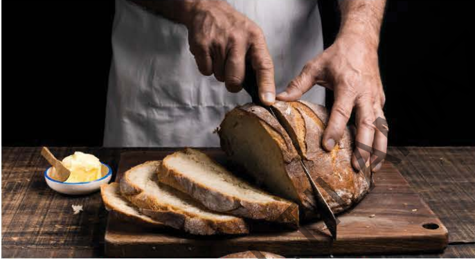
Köy ekmeğini bıçakla kesip dilimlere ayırdık.

" Öğretmen, dersi, bir anda kesip koridordaki gürültüye yöneldi. " cümlesinde " ara vermek " anlamında kullanılmıştır. Bu da sözcüğün cümle içinde kazandığı yan anlamlarından biridir.