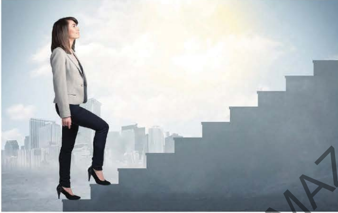
Ağır ağır çıkacaksın hayatın merdivenlerini genç kadın.

Yılların ne kadar hızlı geçtiğini kırklı yaşlardan sonra anlarız. Ahmet Haşim'in, "Ağır ağır çıkacaksın bu merdivenlerden" dizesi bu yaşlarda hızlandırılmış bir film gibi sanki bizi anlatır. Bu cümledeki koyu yazılı kısım, ikilemeyle oluşturulmuş sözcük yinelemesine örnek olarak karşımıza çıkmaktadır.