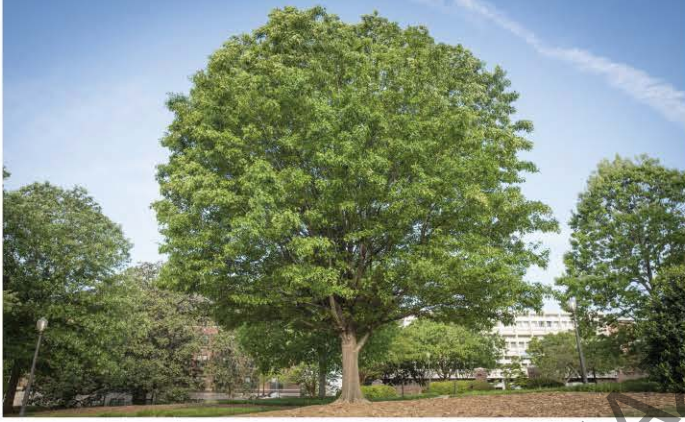
Ağaçlar, doğanın oksijen deposu, kuşların evidir.

Ağaç: Meyve verebilen, gövdesi odun veya kereste olmaya elverişli bulunan ve uzun yıllar yaşayabilen bitki.