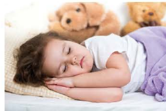
Çocuklar erkenden yatmalı.

Yukarıdaki örneklerde görüldüğü gibi " kesmek, yatmak, dili tatlı " sözcükleri gerçek anlamından uzaklaşırken soyut anlam kazanacak şekilde anlam kazanmıştır çünkü mecaz anlam kazanmış bir sözcüğe okuyucu tarafından yüklenen geçici-soyut bir anlam söz konusudur.