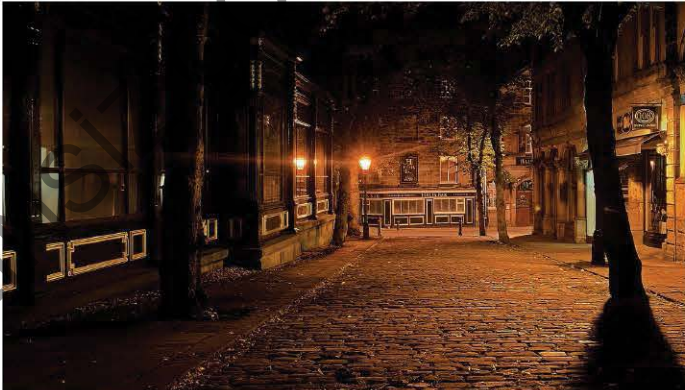
Kaldırımlardaki ışık yavaş yavaş kayboluyordu, cümlesindeki "yavaş yavaş" sözcük grubu hem ikileme hem de yinelemedir.

Kaldırımlar, çilekeş yalnızların annesi, Kaldırımlar, içimde yaşamış bir insandır. Kaldırımlar, duyulur ses kesilince sesi, Kaldırımlar, içimde kıvrılan bir lisandır. Necip Fazıl'ın kaleme aldığı bu dizelerde "kaldırımlar" sözcüğü yine lenerek sözün etkisi güçlendirilmiş, anlam yoğunlaştırılmıştır.