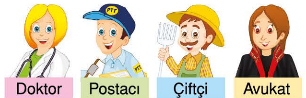
Doktor Postacı Çiftçi Avukat

Yukarıdaki görsellerde dört meslek verilmiştir.