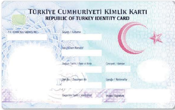
KİMLİK KARTIMIZIN ÖN YÜZÜNDEKİ BİLGİLER

D Resmî kimlik belgesinin görsellerinden yararlanarak aşağıdaki boşlukları doldurunuz.