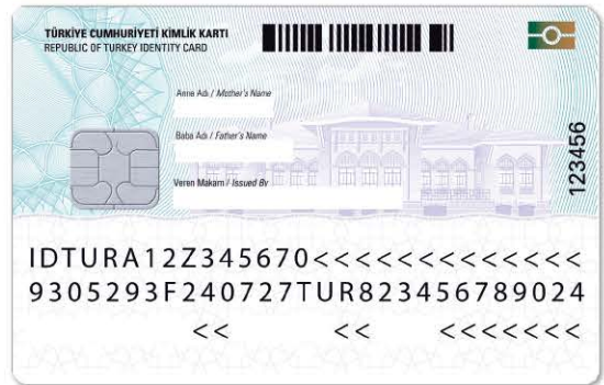
KİMLİK KARTIMIZIN ARKA YÜZÜNDEKİ BİLGİLER