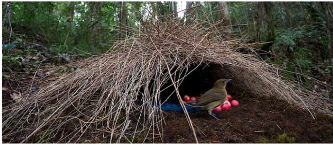
Kuşlar, yumurtalarını yuvalarında muhafaza eder.

Sığınak: Yağmur, güneş veya çeşitli tehlikelerden korunmak için sığınılacak yer, melce.