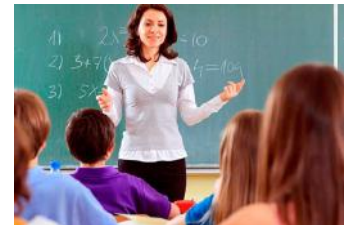
Öğretmenimiz tatlı dilliydi.