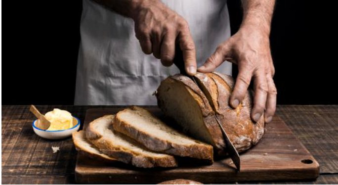
Köy ekmeğini bıçakla kesip dilimlere ayırdık.

" Öğretmen, dersi, bir anda kesip koridordaki gürültüye yöneldi. " cümlesinde " ara vermek " anlamında kullanılmıştır. Bu da sözcüğün cümle içinde kazandığı yan anlamlarından biridir.