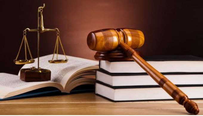
Yargıçlar hukuki bir argümanla yargılar. Cümlesindeki yargı ise yüklemle sağlanır.

"Akıllı bir öğrenci sınıfımıza geldi." cümlesinde birden çok sözcük olmasına karşın yargı " geldi " sözcüğüdür.