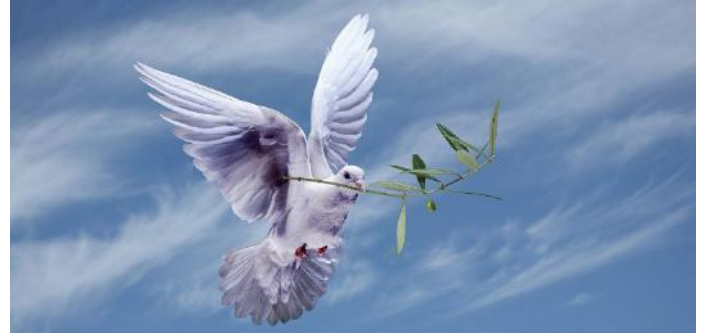
Güvercin ve zeytin dalı "barışın simgesi" dir.

"Güvercin" in barış elçisi simgesi olması veya "zeytin dalı"nın barış sözü ve davranışını karşılaması gibi. Bu iki varlığın yani güvercin ve zeytin dalının "barış" kavramını simgelemesi bu anlamsal süreci açıklamaktadır. Şimdi bir sözcüğün anlam kazanması sürecine bir göz atalım: