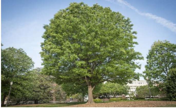
Ağaçlar, doğanın oksijen deposu, kuşların evidir.

Ağaç: Meyve verebilen, gövdesi odun veya kereste olmaya elverişli bulunan ve uzun yıllar yaşayabilen bitki.