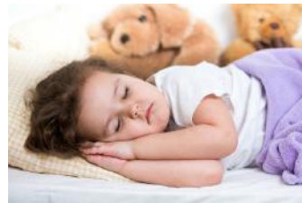
Çocuklar erkenden yatmalı.

Yukarıdaki örneklerde görüldüğü gibi " kesmek, yatmak, dili tatlı " sözcükleri gerçek anlamından uzaklaşırken soyut anlam kazanacak şekilde anlam kazanmıştır çünkü mecaz anlam kazanmış bir sözcüğe okuyucu tarafından yüklenen geçici - soyut bir anlam söz konusudur.