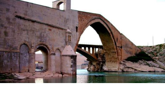
Malabadi Köprüsü (Artuklular)