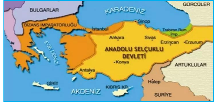
Anadolu Selçuklu Devleti Haritası