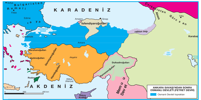
Ankara Savaşı Sonrasında Osmanlı Devleti