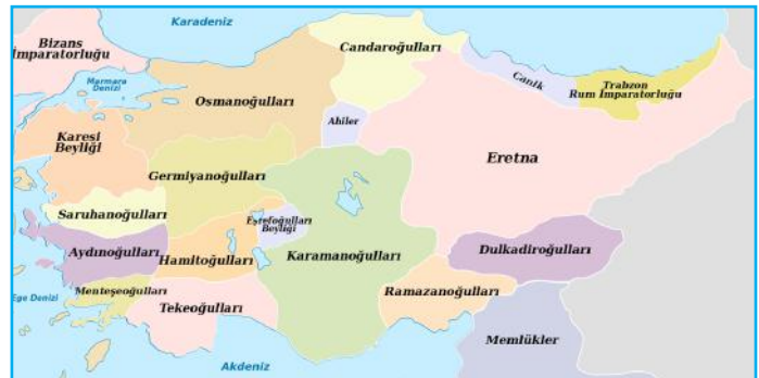
İlk Türk beylikleri haritası

Türk beylerinin bir bir bağımsızlık ilanları sonucu Anadolu'nun Batı kısmında Menteşe, Saruhan, Karesi, Aydın, Candar, Eratna, Osmanlı gibi Türkmen beylikleri kurulmuştur.