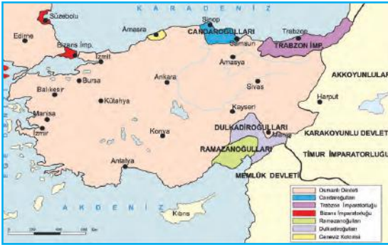
Yıldırım Bayezid Dönemi'nde, Osmanlı Devleti'nin Anadolu Sınırları