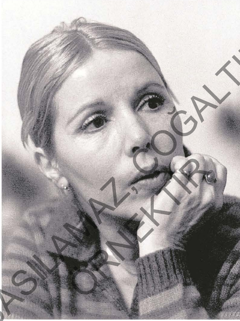
Feruze Çerçi veya tanınan adıyla Füzuan

Çağdas Türk edebiyatının önemli isimlerinden birisidir. Türk öykücülüğünde genellikle "küçük insanlar" diye adlandırılan toplumun ezilmiş, hakkı yenmiş, duyarlıklı iç dünyaları keşfedilmemiş insanlarını yazmıştır. Öykünün yanı sıra şiirden, romana, gezi yazısından, denemeye ve çocuk kitabına kadar edebiyatın farklı türlerinde eserler vermiş, öykülerinin bazıları tiyatro sahnesine ve sinema perdesine taşınmıştır. 1970'li yıllarda en çok dikkat çeken üç kadın yazardan biri olarak Sevgi Soysal ve Adalet Ağaoğlu'yla birlikte anılır.